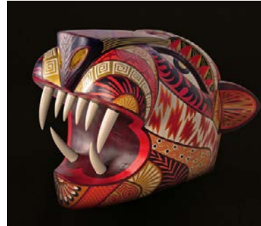
Diseño y Empresa