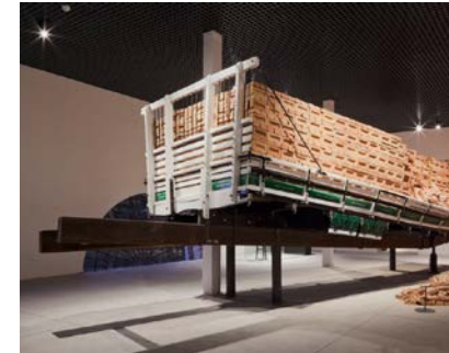
Diseño para (por y con) la cultura