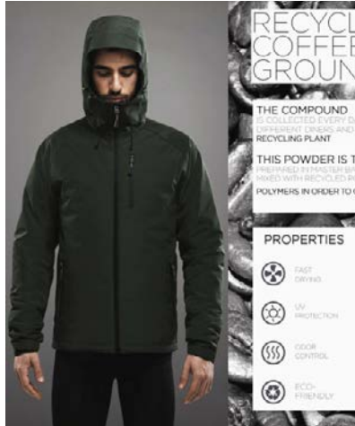
Diseño y Sostenibilidad