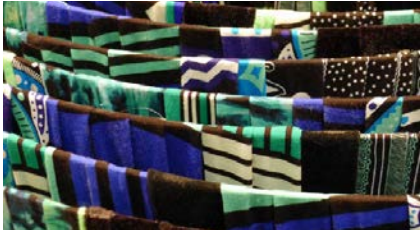
Diseño y Participación ciudadana / UCCI