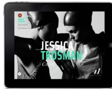
Diseño y Emprendimiento