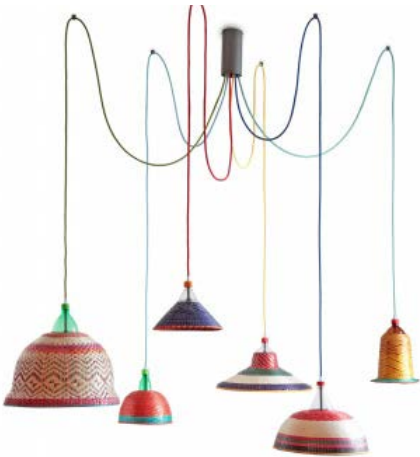
Diseño para el Desarrollo / Cooperación Española