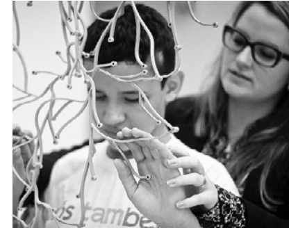
Diseño para Todos / Fundación ONCE