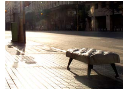
Diseño y Ciudad