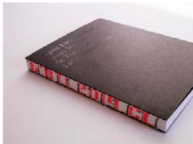
Diseño y Publicaciones de Diseño